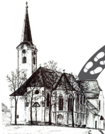
St. Leonhard am Forst