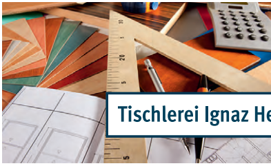
Tischlerei Ignaz Hell