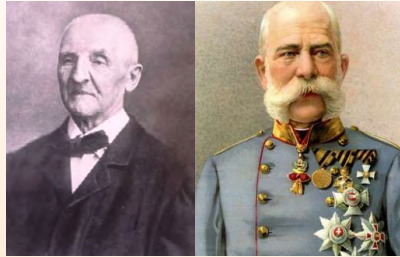
Anton Bruckner (1824-1896)

Sondervitrine: Anton Bruckner und Kaiser Franz Josef